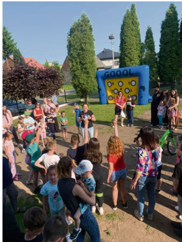
Dzień Dziecka w Broszkowicach.