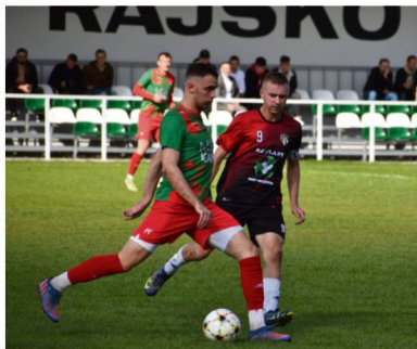
Drużyna z Rajksa może zaliczyć miniony sezon do udanych. Zespół imponował wiosną, gdzie na swoim terenie zachował miano niepokonanej ekipy.