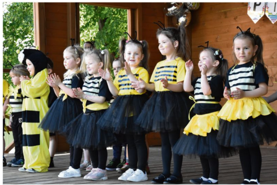
Dzień Rodziny w Porębie Wielkiej.

W tegorocznych obchodach swojego święta, 2 czerwca uczniowie Szkoły Podstawowej w Brzezince mogli wziąć udział w licznych konkurencjach zręcznościowych i turnieju piłki nożnej, poskakać na dmuchańcach, pomalować twarze, kolorowo „wytatuować” ramiona i spleść warkoczyki, poczuć wirtualną rzeczywistość w goglach VR, potać się i zjeść watę cukrową albo popkorn.