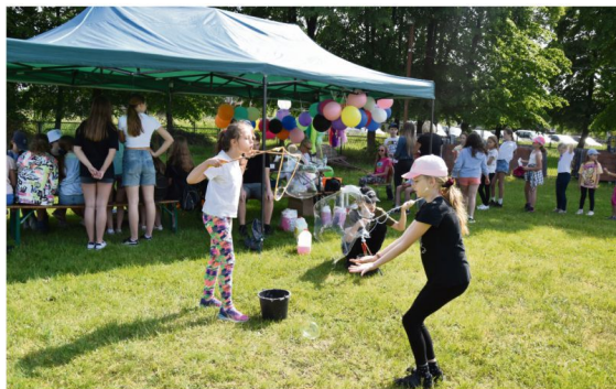
Obchody Dnia Dziecka w Brzezince.