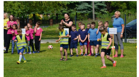
Zmagania we Włosienicy.

Przenoszenie woreczka na głowie albo ping-ponga na łyżce, przeciąganie szarfy i przeskok przez hula-hop, rzut krążkiem na pacholek, a do tego rozmaite ćwiczenia z piłką – wymysłne i trudne konkurencje nie sprawiły kłopotu zawodniczkom i zawodnikom. Wszyscy spisali się na medal, a każda drużyna została nagrodzona pucharem. Imprezę pomogli zorganizować i przeprowadzić członkowie LKS Sygnał Włosienica.