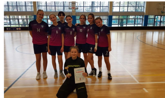
Reprezentantki Szkoły Podstawowej w Brzezince zajęły pierwsze miejsce w powiatowych zawodach w unihokeju.

Szkoła Podstawowa we Włosienicy może poszczycić się szalonymi piłkarkami z młodszych klas, które wygrały zarówno w halowych jak