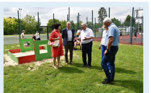
Dzień Dziecka – samorządowcy na placu zabaw w Brzezince.

Najmłodsi z Brzezinki dostali w prezencie na Dzień Dziecka nowe atrakcje, m.in. karuzele, piaskownicę i huśtawkę, na placu zabaw obok orlika przy ulicy Sportowej. Zamontowane w maju wyposażenie kosztowało prawie 50 tys. zł funduszu sołectwa. W najbliższych tygodniach zostanie doposażony, również ze środków sołectkich, plac zabaw w Rajsku.