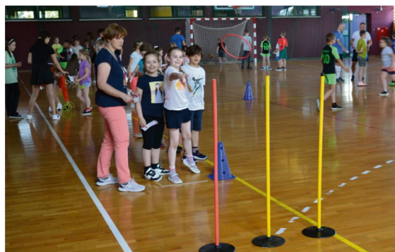
Aktywny Dzień Dziecka w Rajsku.

chańcach, pomalować twarze, kolorowo „wytatuować” ramiona i spleść warkoczyki, poczuć wirtualną rzeczywistość w goglach VR, potać się i zjeść watę cukrową albo popkorn.