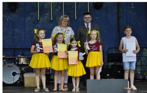
Laureaci Przeglądu „Nutka”