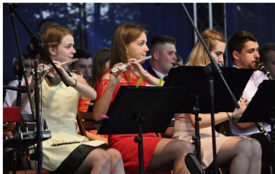
Wielka Orkiestra Młodych Muzyków