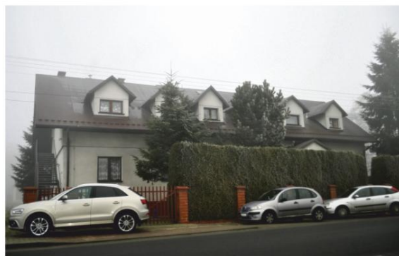
Zmodernizowane przedszkole w Porębie Wielkiej.

Trzy lata temu Miasto Oświęcim wypowiedziało Gminie porozumienie w sprawie podstawowej opieki zdrowotnej. Od tego czasu trwały starania o utrzymanie ośrodków we Włosienicy i Groju. Na szczęście obie przychodnie udało się ocalić. Grojecka od prawie roku służy mieszkańcom – również okolicznym miejscowości – w nowym budynku.