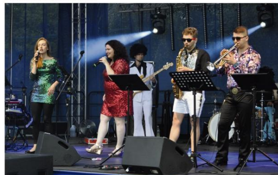
Disco Night Fever