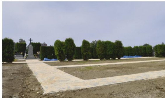
Nowe alejki na cmentarzu w Rajsku.

Inwestycja kosztowała ok. 1,3 miliona złotych, a Gmina Oświęcim jest dzięki niej właścicielem nowoczesnego obiektu, w którym na 220. metrach kwadratowych znajdują się gabinety lekarskie, pracownia rentgenowska i ultrasonograficzna oraz całe niezbędne zaplecze. Od lipca w przychodni w Groju będzie poradnia stomatologiczna w ramach NFZ.