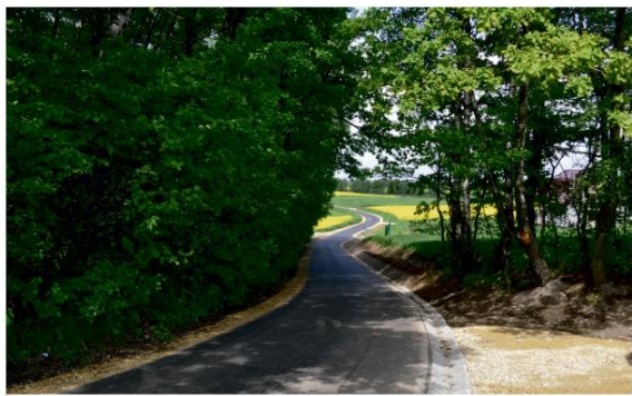
Wyremontowana ul. Przecznicza w Groju.