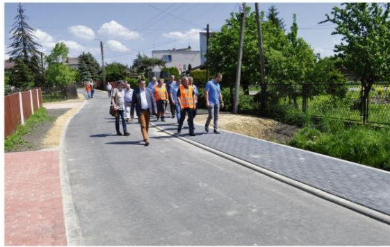
Odbiór robót na ul. Strażackiej w Brzezince.

runku osiedla Błonie w Oświęcimiu) zainstalowano odwodnienie i wykonano nową nawierzchnię – to zadanie było współfinansowane z powiatem. Trwają przygotowania do przebudowy odcinka ulicy Spacerowej – tu także Gmina Oświęcim udzieli pomocy finansowej, a inwestorem ma być powiat.