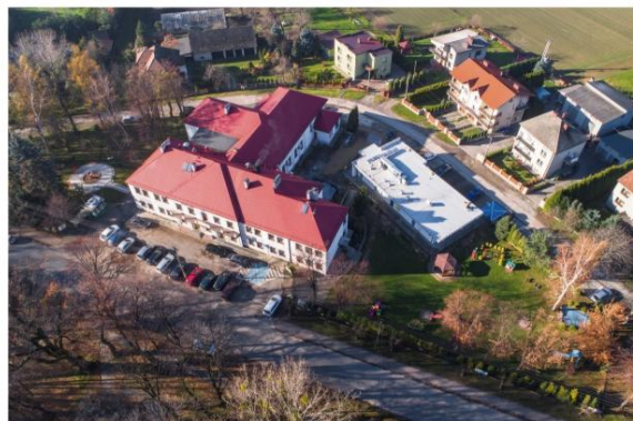
Przeorganizowane centrum Grojca.

Dla mnie bardzo ważne jest też to, że udało się realizować pomysł, który miałem na rozwój tej gminy od