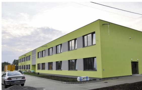
Nowa szkoła w Porębie Wielkiej.