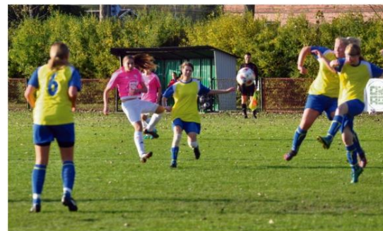
Choć do zakończenia sezonu w kobiecej trzeciej lidze pozostała jeszcze jedna kolejka, to w tabeli wszystko jest już jasne.