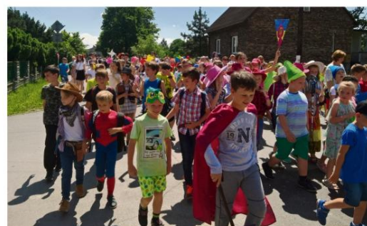
Kolorowy pochód ulicami Brzezinki.