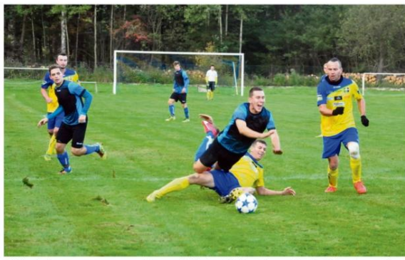
Najwyższym notowanym zespołem z oświęcimskiej gminy w klasie B jest Sygnal Włosienica.

Dobiegł końca futbolowy sezon 2017/18 w klasie B. Na tym szczeblu rozgrywkowym oświęcimską gminę reprezentowało pięć ekip. Najlepiej wypadł włosienicki Sygnal, który sięgnął po wicemistrzostwo. Tuż za podium znalazła się Iskra (czwarte miejsce). Ekipa z Brzezinki wyprzedziła odpowiednio Porębę Wielką i Koronę Harmężę. Na ósmej pozycji sklasyfikowano Puls Broszkowice.