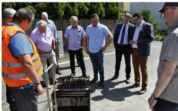
Tocznia ścieków zainstalowana w ulicy Strażackiej.

Koszty skanalizowania Brzezinki skalculowano dwa lata temu na ok. 35 milionów złotych. To kilka razy więcej niż Gmina Oświęcim przeznacza na wydatki majątkowe w ciągu roku. Dlatego wójt Albert Bartosz zdecydował o budowaniu sieci sukcesywnie, podłączając do niej ulicę po ulicy. Z uwagi na rosnące ceny robót