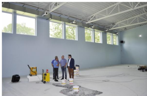
Prawie gotowa sala gimnastyczna Szkoły Podstawowej w Porębie Wielkiej.