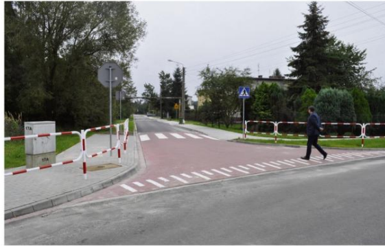
Nowe ulice na Osiedlu Domków w Zaborzu.