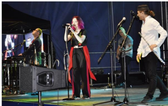
Gwiazdy Dni Gminy 2018 zespół Brathanki.

Na tereny LKS Zaborzanka spadło ledwie kilka kropel deszczu, więc Wielka Orkiestra Młodego Muzyka