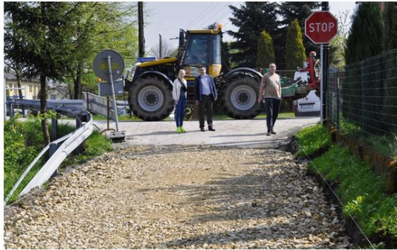
Remont ul. Rzecznej we Włosienicy.

Inwestycje nie omijają przedszkoli. Siedziba placówki w Porębie wymagała modernizacji pomieszczeń i wymiany pokrycia dachu. W Zaborzu zabezpieczono konstrukcję budynku, a podobne prace planowane są w przedszkolu w Brzezince w te wakacje.