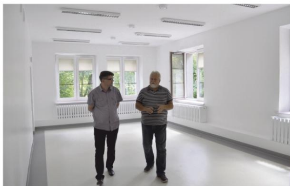
Remont pomieszczeń dla przedszkola w Domu Ludowym w Groju.

Inwestycje w budynki i tereny przekroczyły w omawianym okresie 2 miliony złotych. To bardzo zróżnicowane wydatki, których wspólną cechą jest to, że podnoszą wartość gminnego majątku. Zazwyczaj niemożliwe jest oddzielenie funkcji, jakie spełniają stanowiące własność gminy budynki i tereny wokół nich. Nazewnictwo bywa mylne, bo remiza jest równocześnie domem ludowym, czasem mieści też świetlicę dla dzieci i klub seniora. Dlatego w tym omówieniu nie ma osobnej pozycji "kultura", ani "sport i rekreacja", a katalog instytucji i zrealizowanych inwestycji jest w tej części wyjątkowo zróżnicowany.