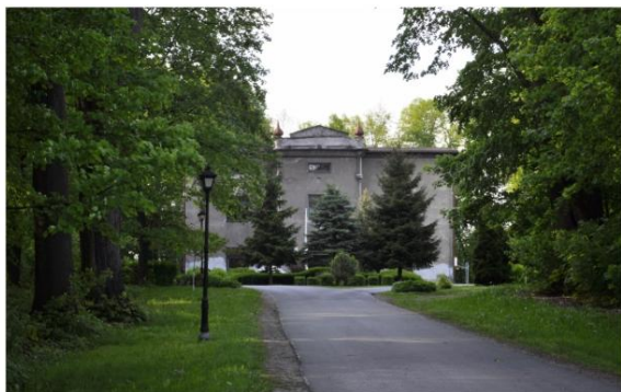
Pałac w Porębie Wielkiej.

Rada Gminy Oświęcim zaplanowała w tegorocznym budżecie dochód ze sprzedaży pałacu w Porębie Wielkiej. Jednak teraz radni odwołują ostateczną decyzję w tej sprawie, mimo że grozi to niezrealizowaniem założonych na 2018 rok zadań inwestycyjnych w kilku sołectwach.