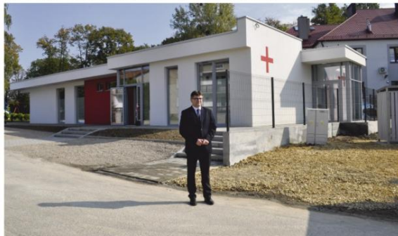
Odbiór ośrodka zdrowia w Groju.

Modernizacja budynku Domu Strażaka w Dworach Drugich była realizowana w kilku etapach w ciągu dwóch lat. Odnowiono główną salę i elewację, wygoszparowano też świetlicę, z której korzystają również dzieci. Remiza w Stawach Monowskich została rozbudowana – na części budynku powstało piętro z nowymi pomieszczeniami. Dom Strażaka w Broszkowicach ma od tego roku nowe, gazowe ogrzewanie, a dalsze prace remontowe w obiekcie są zaplanowane na drugą połowę tego roku. W centrum tego sołectwa urządzono rekreacyjny skwer.