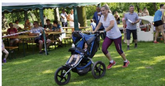
Największe wrazenie wywarła mama startująca w kategorii Open.

26 maja amatorzy biegania rywalizowali na terenie Przedszkola Samorządowego w Zaborzu.