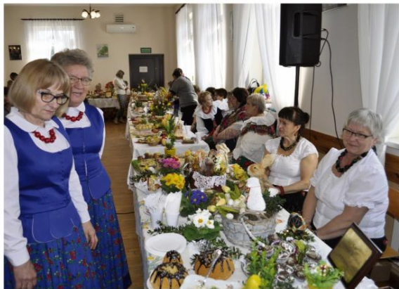
Degustacja świątecznych smakołyków, to już coroczna tradycja Spotkań z Tradycją Świąteczną.