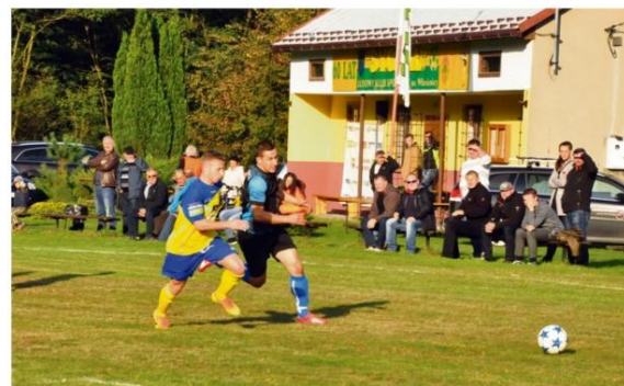
Piłkarze Sygnału są trzecią siłą w klasie B. Włosieniczanie wyprzedzają tylko zespoły z Gorzowa i Oświęcimia.