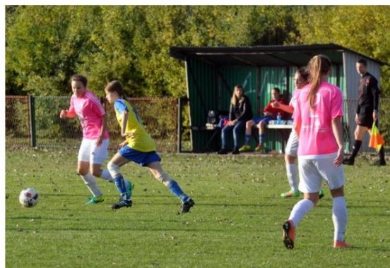
Iskierki z Brzezinki będą w rundzie rewanżowej atakowały pozycję trzeciogigowego lidera.