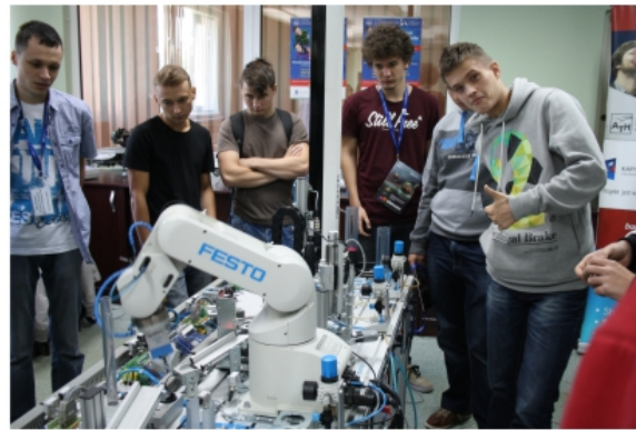
Fot. PCKTIB (Ozety)

i ochrona środowiska. Brzeszcze – PZ Nr 6