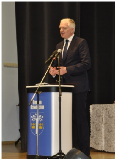
Gościem uroczystości w Grojcu był wicepremier Jarosław Gowin.

w polskiej państwowości, w polskiej wsi, w polskim samorządzie. Mijają wieki, a sołtysi ciągle odgrywają tę szczególną rolę. Jesteście najbliższą ludźmi. Potwierdza to misja, którą obrabio sobie Małopolskie Stowarzyszenie Sołtysów. W statucie na pierwszym miejscu znajduje się działanie na rzecz pomocy społecznej. Dziękując wam za