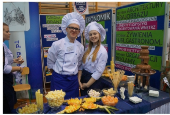
Fot. PZ nr 4 SEG (Ekonomik)

Technik weterynarii – zagadnienia dotyczące zwierząt hodowlanych i domowych, w powiązaniu z kwestiami z dziedziny: rolnictwo, leśnictwo