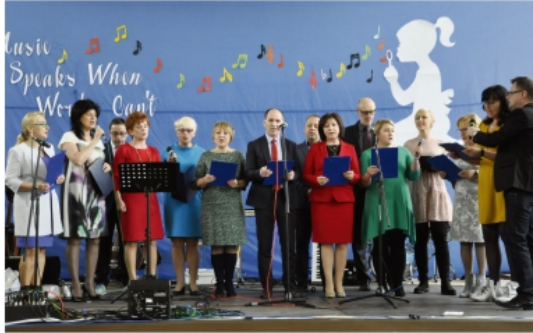
Dyrektorzy szkół i przedszkoli zaśpiewali na Koncercie dla Basi piosenki "Moja i twoja nadzieja" i "Chodź, pomaluj mój świat".

Pragniemy gorąco podziękować młodym artystom i ich opiekunom. Gratulujemy przepięknych aranżacji i wykonań znanych przebojów polskiej i światowej piosenki.