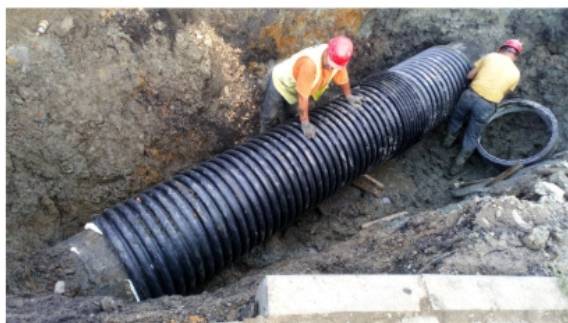
Budowa kanalizacji sanitarnej w ulicy Brzozowej – sierpień 2018 r.