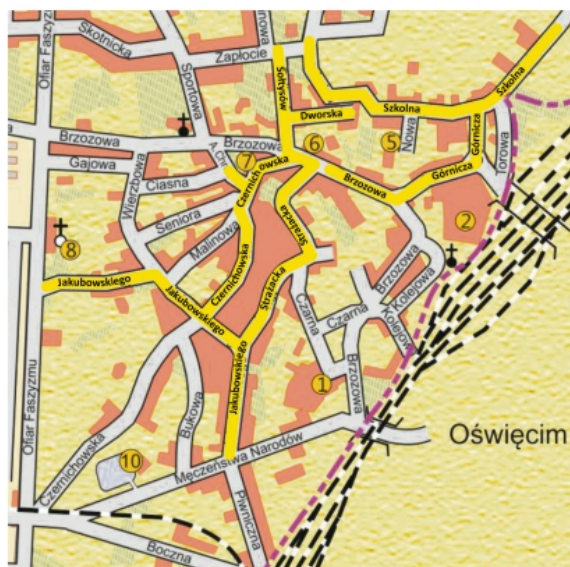
Sieć kanalizacji sanitarnej w Brzezince.